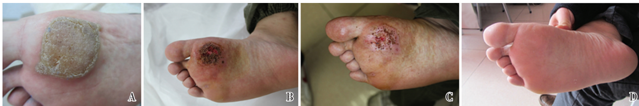
A: plantar warts before photodynamic therapy; B: plantar warts after once PDT; C: plantar warts after twice PDT; D: plant warts after three times of PDT treatment

跖疣是发生于足底的寻常疣,因其常发生于受压部位,疣体嵌入较深,有的可深达真皮层或皮