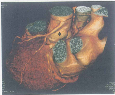
图4 冠状动脉开口异常

(When the stem of the left coronary artery was shorter) Lumen stenosis (arrow) caused by arteriosclerosis is noted as the stem of the left coronary artery was shorter (arrow head). Dominance graph reveals three-dimensional structure of heart and blood vessel by VRT. Right steak graphs reveal appearance of artery from different lateral views which is marked by the green line at dominance graph. Small cages show their transverse appearance.