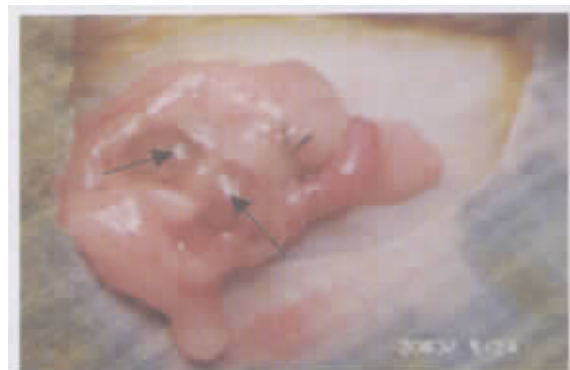
图1 模型成功建立后的异位灶

术后第3周行第2次开腹,移植成功的指标为:肉眼可见移植物增大,可呈隆起的小泡状,有些形成多房的囊肿,囊肿内充满黄色或清亮浆液,移植物被结缔组织覆盖并有血管形成,部分移植物呈黄色或褐色小结(见图1)。经HE染色,病理示:移植物中有内膜上皮细胞、腺体及间质细胞生长,光镜下可见明显的子宫内膜腺体和间质,腺上皮呈柱状或高立方状,体积增大,胞浆浓染,核浆比增大,内膜腺体丰富,腹腔内并有分泌活动,可见核下空泡(图2)。