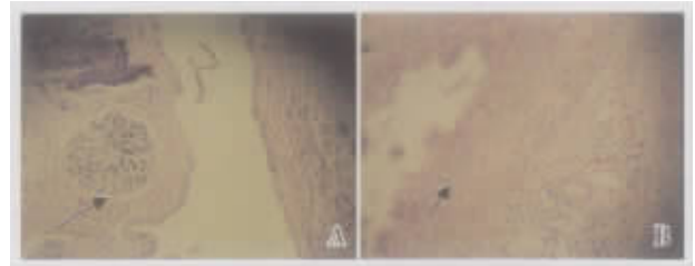
图 3 用药后的异位内层组织学表现

2.2.1 异位病灶的形态观察 用 rhPRL 治疗后, 异位病灶缩小, 粘连受到明显的抑制, 以低剂量效果较好(表 1)。镜下见异位内层上皮细胞坏死(图 3)。