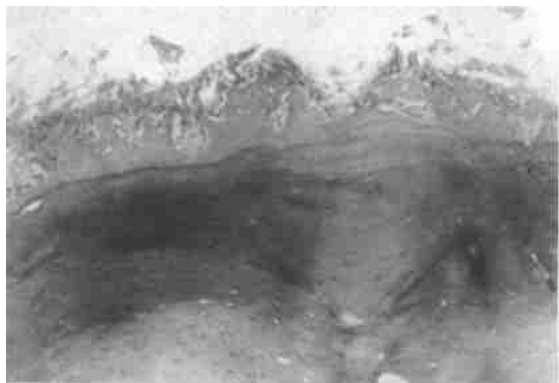
图1 骨膜血管增多,骨膜下成骨活跃,无死骨

R+HBO组有6例,R组有2例见骨膜增厚,血管显著增多,有较多粒细胞和淋巴细胞浸润,骨膜下成骨活跃,有较大量新生骨堆积,骨膜与骨膜下组织结合紧密(图1)。R+HBO组另2例和R组另6例见骨膜萎缩,血管丧失,炎症组织浸润不明显,骨膜与骨面分离(图2)。