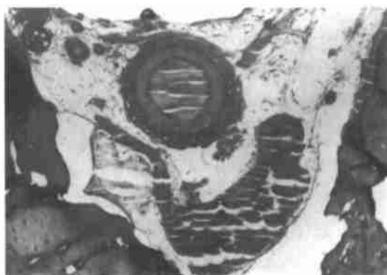
图3 骨髓腔见纤维化,血管无缩窄(或偶有扩张)

病理学观察到,R组中符合颌骨ORN有6例(6/8),R+HBO有2例(2/8),经 \chi^2 检验, P < 0.01 。