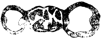
图 1 带环式粘接桥